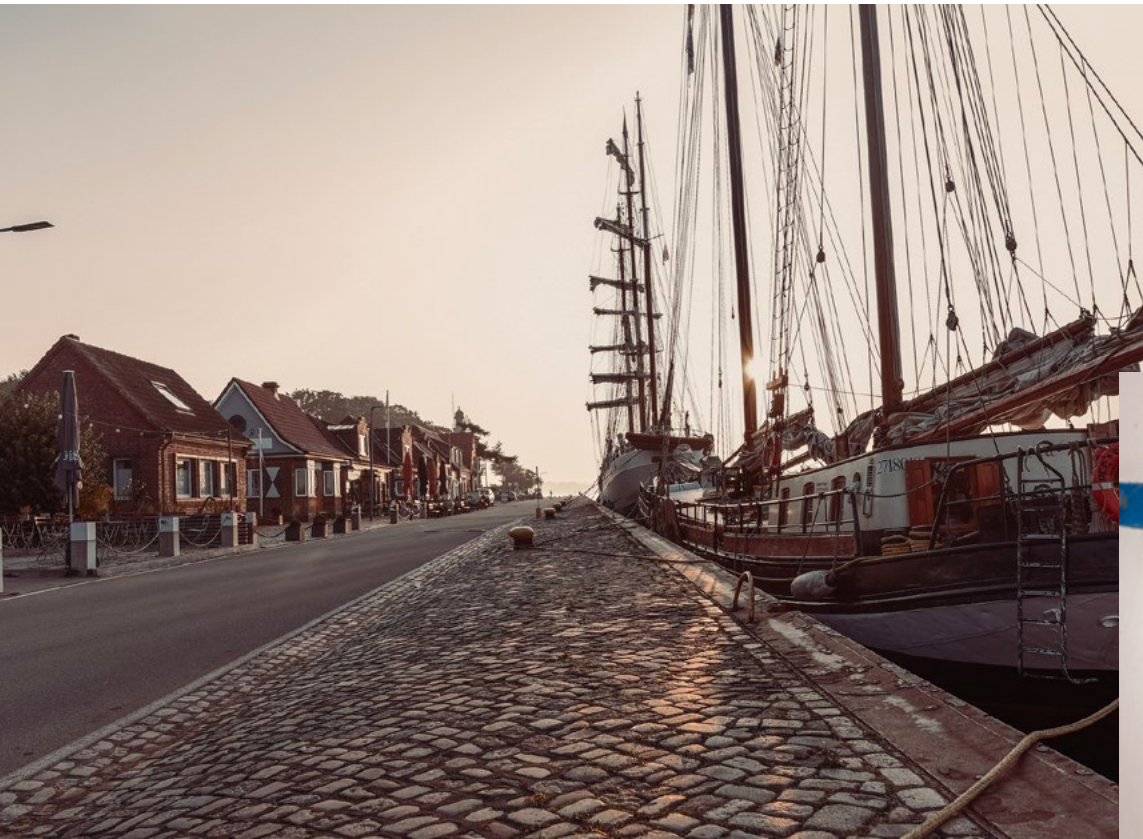
Unser Firmensitz am Tiessenkai in Kiel

Im Jahr 2019 haben wir das Büro ausgebaut und dabei ökologisch ausgesuchte Materialien verwendet. Die Finanzierung erfolgte aus Eigenmitteln und durch die Schwesterfirma Coastal Research & Management (CRM). Wohlfühlfaktor am Rande: Noch mehr Mitarbeitende schauen nun von ihrem Arbeitsplatz aufs Wasser! Und tun etwas für ihre Gesundheit, denn es wurden auch 10 E-Bikes (gemeinsam mit CRM) angeschafft und ein Elektroauto geleast.