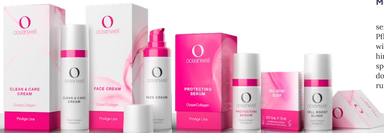
Produkte der OceanCollagen ProAge Line

Unsere Kosmetik-Verpackungen sind produktsicher, leicht sowie komplett und regional recycelfähig, und daher dem derzeitigen Stand der Technik entsprechend klimaneutral. Die Airless-Spender sind hygienisch und ermöglichen es uns, den Produkten weniger Konservierer beizumengen – ganz im Sinne unserer Naturkosmetik.